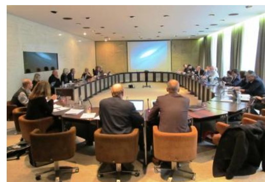
Članovi Skupštine ApPEC-a